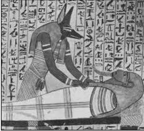
Peinture murale égyptienne.

Ce cours, qui s'étend sur l'année scolaire, est une étude approfondie de l'art et de la civilisation de l'Égypte ancienne , depuis la préhistoire jusqu'à la période romaine. Il est la synthèse critique des enseignements de l'égyptologie à l'Université de Liège et à l'École du Louvre.